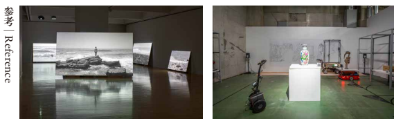
左 left: 潘逸舟「MOTアニュアル2021 海、リビングルーム、頭蓋骨」展示風景 (東京都現代美術館) HAN Ishu, Installation view at "MOT Annual 2021: A sea, a living room, and a skull," Museum of Contemporary Art Tokyo | 撮影: 森田兼次 Photo: MORITA Kenji 右 right: やんツー《Great Emptiness》2024「TERRADA ART AWARD 2023 ファイナリスト展」展示風景 (寺田倉庫 G3-6F、東京、2024) yang02, Great Emptiness , 2024, Installation view at "TERRADA ART AWARD 2023 Finalist Exhibition," Warehouse TERRADA G3-6F, Tokyo, 2024 撮影: 鈴木雄介 Photo: SUZUKI Yusuke

A contemporary art award supporting mid-career artists interested in working internationally. The Award Exhibition by the sixth edition winners will be held at the Museum of Contemporary Art Tokyo in 2027.