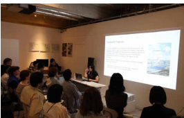
「キュレーター・トーク Vol. 8」2025

*Booking required / Conducted in English