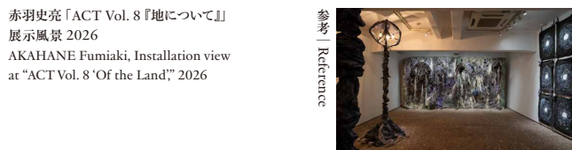
赤羽史亮「ACT Vol. 8『地について』」展示風景 2026 AKAHANE Fumiaki, Installation view at "ACT Vol. 8 'Of the Land,'" 2026

いま注目すべきアーティストを紹介する企画展。 Exhibitions introducing noteworthy artists of the day.