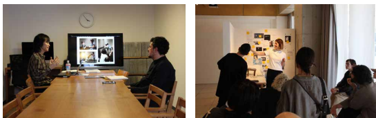
TOKASレジデンスでの活動の様子。左: メンタリング・セッション 右: コーヒー・ミーティング Activities at TOKAS Residency. left: Mentoring Session right: Coffee Gathering

*「Tokyo Contemporary Art Award」および「OPEN SITE」は、2027年度以降に公募を実施予定です。 *Open calls are planned to be held in 2027 or later for the "Tokyo Contemporary Art Award" and the "OPEN SITE."