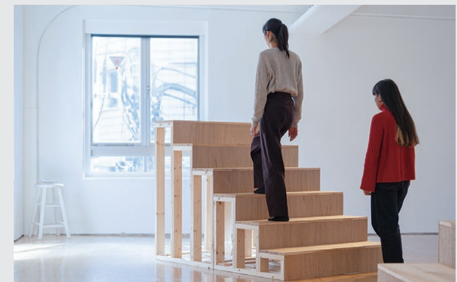
6steps「6stepsを置いてみる-TOKAS本郷編-」公演風景 2024 (OPEN SITE 8) 6steps, performance "6steps / place the choreography @ TOKAS Hongo," 2024