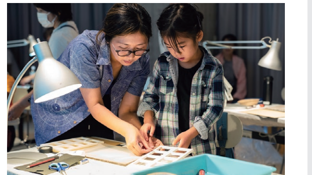
「夏のこどもワークショップ」2023 "Summer Kids Workshop," 2023

At TOKAS, we use multifaceted approaches to connect the arts audience with the artists, their works and creative activities by the artists and creators taking part in our programs. These include talks and workshops to deepen understanding of creation and works of art, using our archives to broaden the range of our audience, plus other online services, our e-mail Newsletter and Annual Report, etc., and many other efforts to provide places for creative activities to more and more people.