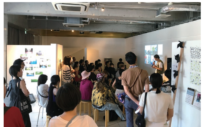
「オープン・スタジオ 2023-2024/7月」2023 "OPEN STUDIO 2023-2024/July," 2023