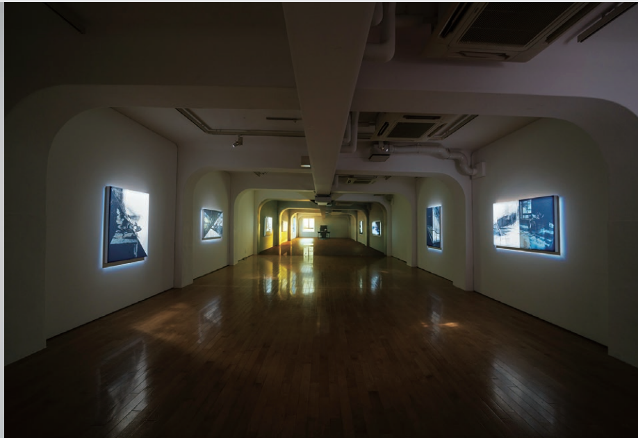
菅 雄嗣「メニール」展示風景 2024 (ACT Vol. 6) SUGA Yushi, installation view at "Layers of Optical Experience," 2024