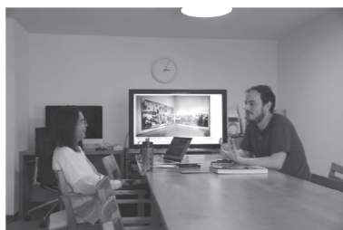
メンタリング・セッション