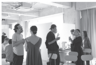
コーヒー・ミーティング