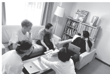
テーマ・ミーティング