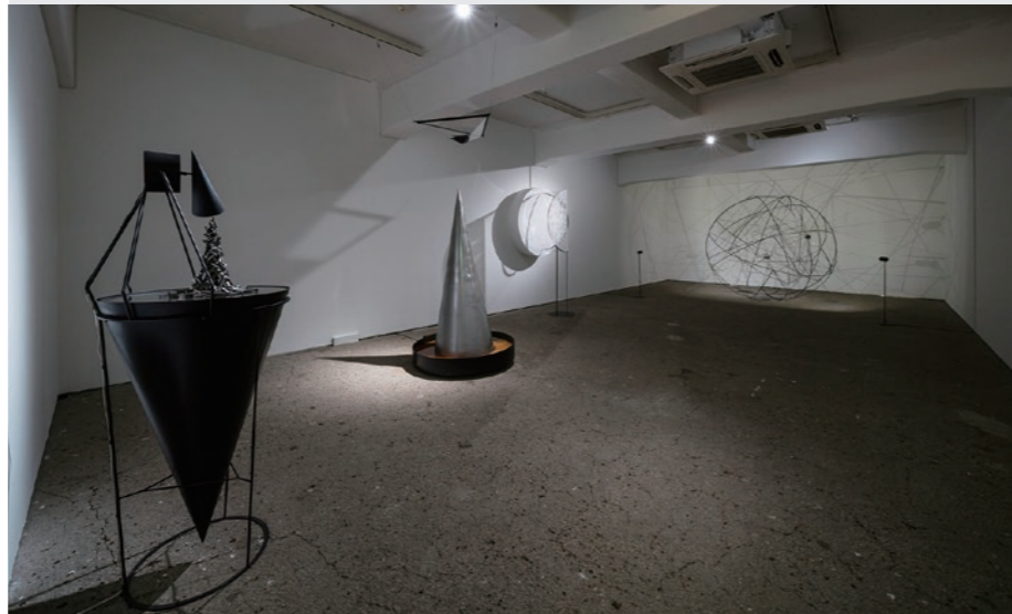
砂田百合香《engram》展示场景2019 (TOKAS-Emerging 2019)

向新锐艺术家提供发布机会的“TOKAS-Emerging”、以参与TOKAS事业来累积业绩的艺术家为中心的群展“ACT”、与东京都共同举办的“Tokyo Contemporary Art Award”等, 对艺术家进行持续的支援。