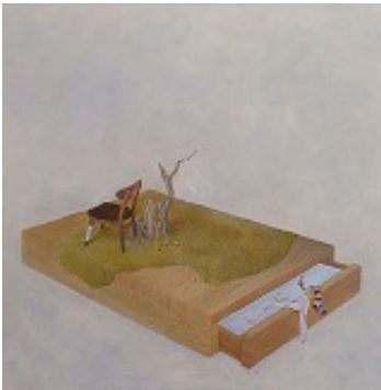
《記憶の箱》2009、油彩、カンヴァス

日常に秘められたこと、過去に結びつくこと、と出会ったとき、人はどんな感情を抱くのか。