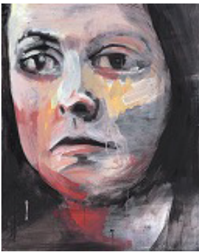
《THAT PERSON》2009、油彩、水性ペンキ、カンヴァス