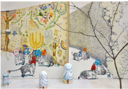
〈f.tiger- from bubbles to wall〉2009、ミクストメディア