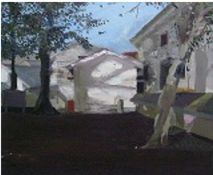
《家》2009、油彩、カンヴァス

「ある日、私はもう思い出さなくてもいい記憶をすてることにした。忘れようとしても忘れられなかったあの記憶を。」 -制作ノートの中から