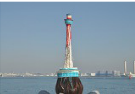
〈マリナーヘッドタワー〉2009、ラムダプリント

knitでカタチを作る行為は、出産のイメージに結びついている。生まれるべき子供たちと実際に生まれることの無かった無数の子供たち。日々、作品は揺れ動き成長し、子供たちは姿を変えていく。