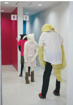
〈飛び立ち距離〉2007、綿、羊毛、針金、石膏、発砲スチロール、布

私の提示は、あらかじめ掛けられた呪いを解く呪文を探す旅のレポートであって、呪文そのものではない。