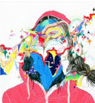
〈ピンクのパーカー〉2008、ドローイング、紙

ワタシもキミも、きっとホシだって、誰しもがそれぞれの物語を持っていて、それは私の知っている範囲を超えて、どこまでも広がっているのだらうと想像するのです。 たくさんのお話がつくれ、共存して世界は形づくられているように思うのです。