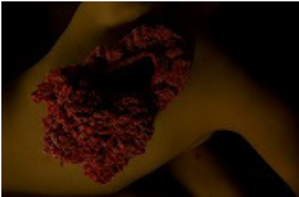
〈organ〉2008、糸、テグス、デジタル写真