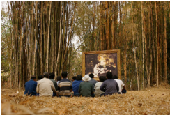
〈Manet's Dejeuner sur l'herbe 1862-1863 and the Thai villagers〉, 2008 Video Installation, 16 mins

1957年タイ生まれ。立体作品、インスタレーション、パフォーマンス映像、写真など、死や嘆きのイメージに女性の性やアイデンティティを映す作品を多く発表している。ヴェニスビエンナーレ・タイ館(2005)、シドニービエンナーレ(2010)他、国際的に活動している。