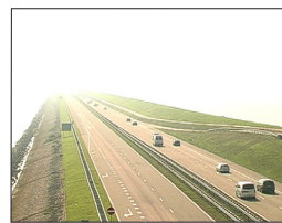
〈Enclosures〉, 2004, Colour, Sound, 22min

1973年バイルート(レバノン)生まれ。アイデンティティ、空間の占領、移動、レバノンの政治的な歴史などを題材にしたビデオエッセイを多く制作している。