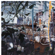
〈GreenHouse_#03〉, 2009, Oil on Canvas, 140×140cm

1969年ソウル(韓国)生まれ。大学で絵画を学んだ後、作品の文脈上の要素を伝えるため様々なメディアを使い作品を制作している。主に、歴史的、社会的事実と独自の心理的観点とともに理想と現実、個人と社会の関係について言及している。