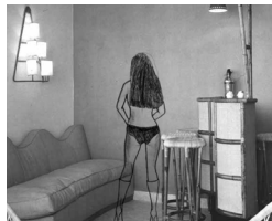
〈(I've heard 3 stories)〉, 2009, Video and hand drawn animation, 12min43sec

1978年バイルート(レバノン)生まれ。都市についての歴史的、理論的なりサーチをもとに、特定の場所や建築物からものを集め、ドローイングやアニメーション、脚本など多様な方法でそれらを作品化している。