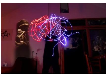
登崎榮一 小西徹郎 「BCD Sound Performance」