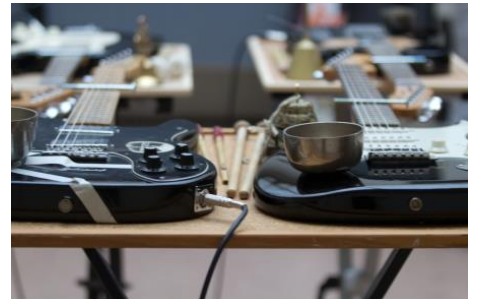
エックス・イースター・アイランド・ヘッド 「Duo for TEF」