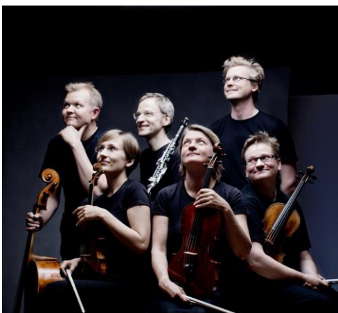
Avanti! Chamber Ensemble