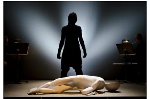
ヴァリヨ・アンサンブル 「月に憑かれたピエロとその影」