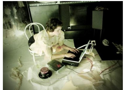
トレーシズ・コレクティブ 「Input Place in Space A」