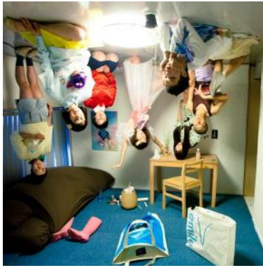
快快 FAIFAI 「六畳間ソーキュート社会」 ☆