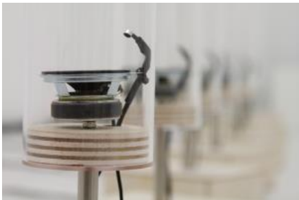
大野茉莉 「acoustic cluster」 ◎