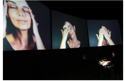
ヤロスワフ・カプシチンスキー「Where is Chopin?— インスタレーション&インターメディアリサイタル」