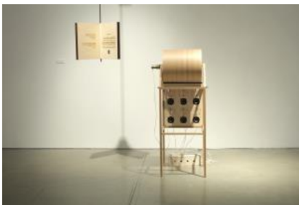
フィービー・ホイ 「Mediators」 ◎ ☆