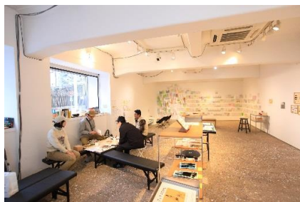
9. 宮田 篤 「びぶんボックス」ことばの店: 微分帖