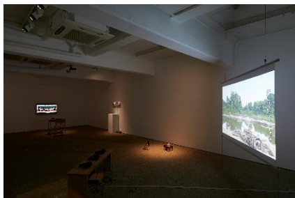
1. 本間メイ 「つぎはぎの“言葉”(字 ことば kata eweaweae)」