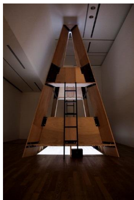
6. 《CV Projection 1》2015 ミクストメディア

1985年生まれ。2016年東京藝術大学大学院美術研究科美術専攻先端芸術表現領域博士課程修了。