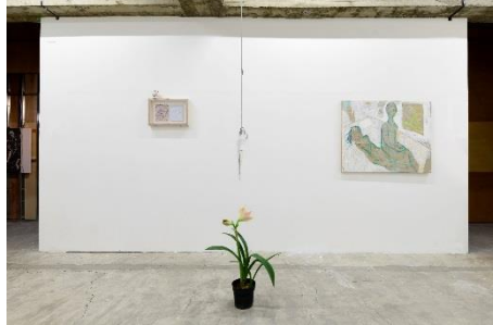
4.ON MAY FOURTHでの展示風景 2018