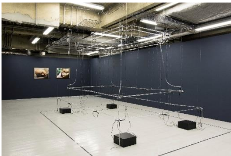
2. 《空の台座》2017 ネオン管、アクリル、電線