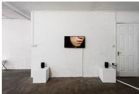
5. 《I am Listening to You》(展示風景) 2018

1988年生まれ。2015年ロンドン芸術大学ロンドン・カレッジ・オブ・コミュニケーションMAサウンド・アーツ修了。