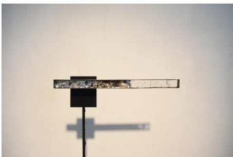
3. 《engram》2018 鉄、レンズ、モーター