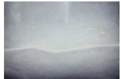
5. 《壁》2017 油彩、キャンバス、130×194cm

1988年東京都生まれ。東京都を拠点に活動。2015年武蔵野美術大学大学院造形研究科美術専攻油絵コース修了。主な展覧会に「BankART Life V “観光”」(BankART Studio NYK、神奈川、2017)、「群馬青年ビエンナーレ2017」(群馬県立近代美術館)、「そこ、」(櫻木画廊、東京、2016)、「FACE2016損保ジャパン日本興亜美術賞展」(損保ジャパン日本興亜美術館、東京)。受賞・助成歴に「第32回ホルベイン・スカラシップ」奨学生(2017)など。