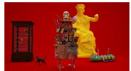
6. 《Repetition game》2017 HDビデオ、5分00秒

1991年長野県生まれ。東京都を拠点に活動。2014年武蔵野美術大学造形学部彫刻学科卒業。主な展覧会に「第18回グラフィック『1_WALL展』」(ガーディアン・ガーデン、東京、2018)、「EWAAC London」(La Galleria Pall Mall、ロンドン、2017)、「PLUS ULTRA 2015」(スパイラルガーデン、東京)、「Art Jam 2014」(Gallery Jin、東京、2014)「New Artist 2014」(Gallery Jin、東京、2014)。受賞歴に「第21回文化庁メディア芸術祭」アート部門審査委員会推薦作品選出(2018)、「第18回グラフィック『1_WALL展』」グランプリ(2018)。