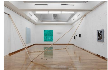
2. 世田谷美術館区民ギャラリーでの展示風景 2015

1983年三重県生まれ。東京都を拠点に活動。2012年筑波大学芸術専門学群美術専攻卒業。主な展覧会に「The violent silence of a new beginning」(Studio Khana for Contemporary Art、カイロ、2017)、「Bebop」(XYZ collective、東京、2016)、「世田谷区芸術アワード“飛翔”受賞記念発表『清水総二展』」(世田谷美術館区民ギャラリー、東京、2015)、「Itch」(みどり荘、東京、2015)、「クロスディゾルブ」(遊工房アートスペース、東京、2014)、「アラフドアートアニュアル2013」(土湯温泉町、福島)など。