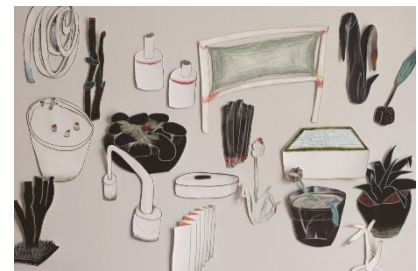
3. 《昔の日記、通勤と散歩》2018 アクリル、紙 サイズ可変

1989年東京都生まれ。東京都を拠点に活動。2015年多摩美術大学大学院美術研究科絵画専攻油画研究領域修了。主な展覧会に「-画廊からの発言-新世代への視点2017 中野由紀子展『近くの空き地、遠くの景色』」(藍画廊、東京)、「中野由紀子展『昔の日記、通勤と散歩』」(circle [gallery & books]、東京、2017)、「中野由紀子展『かわる景色』」(藍画廊、東京、2016)、「五美術大学展」(国立新美術館、東京、2015)など。受賞・助成歴に「アクリルガッシュビエンナーレ2016」佳作、「第31回ホルベイン・スカラシップ」奨学生(2016)。