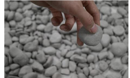
4. 《なみうちぎわの協和音》2018 粘土、サイズ可変

1985年静岡県生まれ。静岡県を拠点に活動。2009年沖縄県立芸術大学大学院彫刻専攻修了。主な展覧会に「ファルマコン-医療とエコロジーのアートによる芸術的感化」(ターミナル京都、京都/CAS、大阪、2017)、「2015 イチハナリアートプロジェクト+3」(浜比嘉島、沖縄)。受賞・助成歴に平成28年度文化庁新進芸術家海外研修制度1年研修(パリ国際芸術都市レジデンス、2016)、「グランシップアートコンペ2011」グランシップ賞、「アート・ミーツ・アーキテクチャーコンペティション(AAC)2006」最優秀賞。