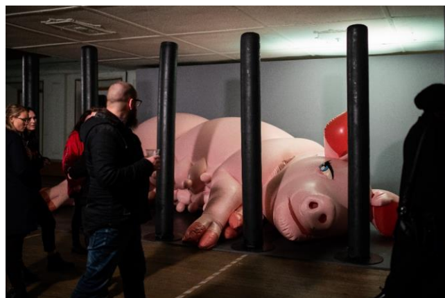
4. 「DARK MOFO 2019『Pigpen』」公演風景 (Avalon Theatre、ホバート、オーストラリア)