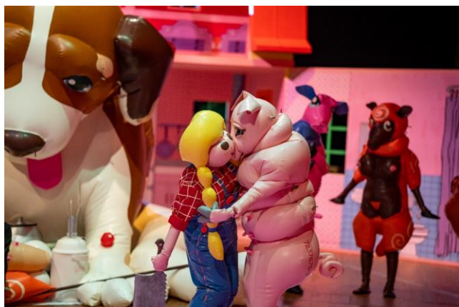
3. 「Cycle of L」公演風景 (高知県立美術館、2020)

またボディスーツによって拘束され、不自由になったパフォーマーの身体が必然的に「ケア」されるようになるという構造をポジティブなこととして捉える視点は、社会における関係性の認識に一石を投じるものであり、強さと弱さ、支える側と支えられる側、といった固定概念を問いなおす。作家が社会的包摂活動に長くコミットし、その活動があらゆる生命を平等に尊重しようとする制作態度や作品にも強く関連づけられていることは、私たちが真の多様化を目指すにあたり、多くの人々に共有されうるものと評価した。