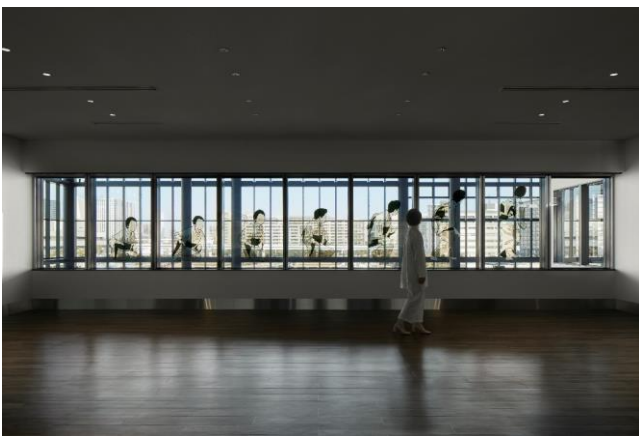
1. 《東京仕草》2021「Back TOKYO Forth」展示風景（東京国際クルーズターミナル、2021）

その芸術的実践と作品はどちらも、鑑賞者に内省と、社会における相互理解を生み出すため、個人的な変革ではなく、構造的な変化の必要性を批判的に自覚させており、改めてそれら活動を貫く関心と動機の一貫した強い制作態度が評価された。