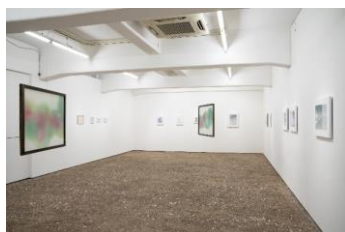
1 むらたちひろ 「Internal works / 彼方の果」