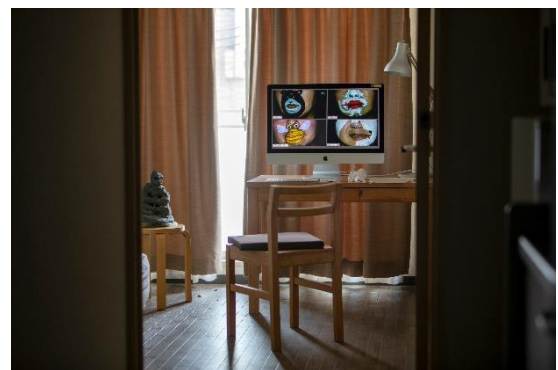
2. 《マッカーサー銅像ミーティング(オンライン)》2021 ビデオ

歴史、環境、身体の関係性から、不可視の「幽霊」のような存在に形を与えることを主題に制作を行う黒田。東京の公共彫刻と、戦後実際にあったマッカーサー像建造計画についてリサーチをする傍ら、コロナ禍において、ほぼ自身一人のみでレジデンスに滞在していたという環境を重ね合わせることで、あり得たかもしれない架空の「誰か」との対話をインスタレーションで表します。