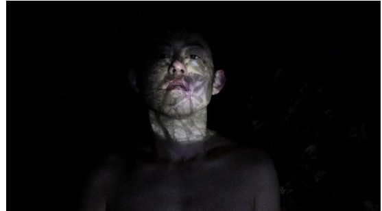
3. 《Scape》2022 4Kビデオ

自身の行為を変換し、確認するための手法として、主に写真を用いた表現を行う前谷は、東京を流れる川や水路に、都市の空白地点としての側面があることに着目し、リサーチを進めました。本展では、映像作品やセルフ・ポートレートなどの写真作品から、風景と身体の関係を探求しています。