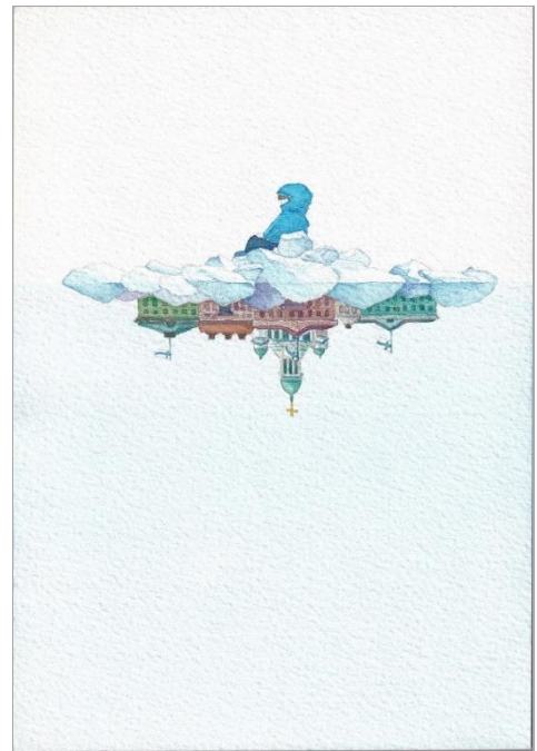
1. 《Pelagos [Helsinki Cathedral]》2021 紙に水彩、色鉛筆、鉛筆

【プロフィール】1982年千葉県生まれ。千葉県を拠点に活動。2010年東京藝術大学大学院美術研究科修了。主な展覧会に「RADIO DU VIVANT」(フランス国立自然史博物館・パリ植物園、2022)、「From Seeing to Acting」(Looiersgracht 60、アムステルダム、2021)、「Lands and the Beyond | 大地の声をたどる」(ポーラ ミュージアム アネックス、東京、2021)など。