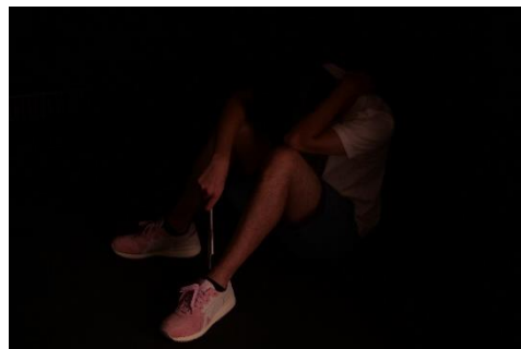
《国際展にて》2020

1993年千葉県生まれ。2019年多摩美術大学大学院美術研究科博士前期課程彫刻専攻修了。