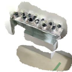
《ルリジサの茶》2020 フォトグラマトリによる3Dモデル

1991年東京都生まれ。2019年東京藝術大学大学院美術研究科グローバルアートプラクティス専攻修了。