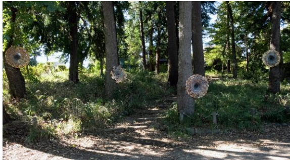
《一葉一環》2019 真鍮、公園の植林にインスタレーション

1987年愛知県生まれ。東京藝術大学大学院美術研究科博士後期課程先端芸術表現専攻在籍。