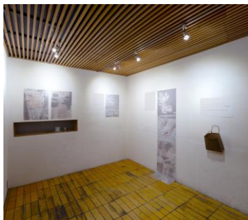
「female artists meetingのための 展覧会(どのような秘密や緊張、葛藤が生まれるんだらう!)」展示風景 2019 Art Center Ongoing、東京(うらあやか+津賀恵として)