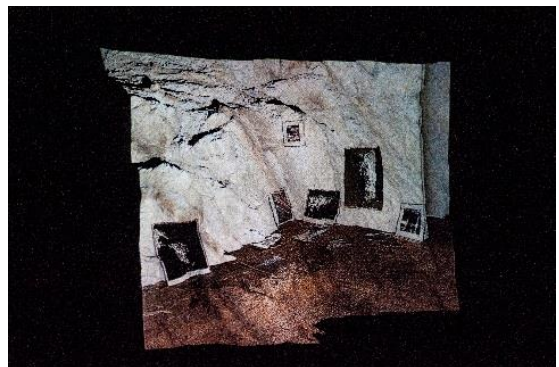
5. 《34°57'15.6"N 139°47'02.5"E》2019

1992年千葉県生まれ。東京都を拠点に活動。2014年東京工芸大学芸術学部写真学科卒業。主な展覧会に「Quarry / ある石の話」(Yumiko Chiba Associates、東京、2018)、「VOCA展2018 現代美術の展望—新しい平面の作家たち」(上野の森美術館、東京)、「測量 | 山」/ 「砂の下の鯨」(資生堂ギャラリー、東京、2017)。主な受賞歴に「Prix Pictet Japan Award」ファイナリスト (2018)、「第11回写真1-WALL」展 グランプリ (2014) など。