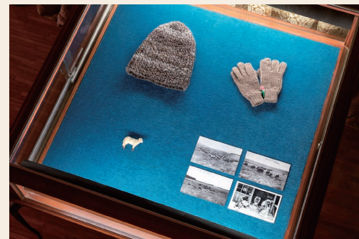
Artifacts about Sheep / 2017-