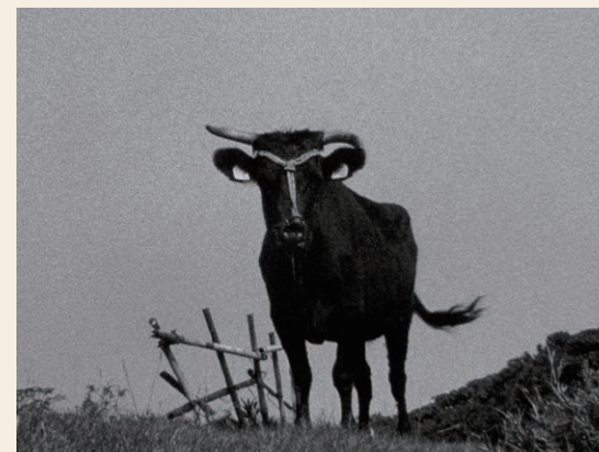
見島牛 / 2015