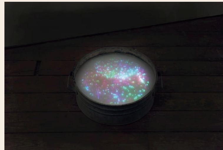
bucket garden / 2012