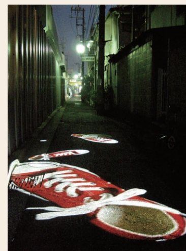
赤い靴 / 2009